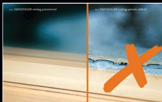
Hőhidmentes műanyag távtartós üveg

Melegperemes üvegezés alkalmazása esetén az üveg hőátbocsátási tényezője ( U_g ) jelentősen csökkenthető. Előnye, hogy az üveg közti gyenge hőszigetelésű alumínium távtartó helyett alacsony hővezető képességű műanyag távtartót alkalmazunk. A technológia alkalmazásával csökkenthetjük a belső oldali perem menti páralecsapódás veszélyét.